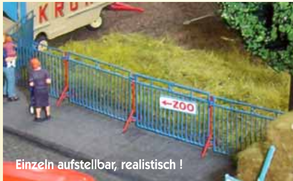
Einzel aufstellbar, realistisch !