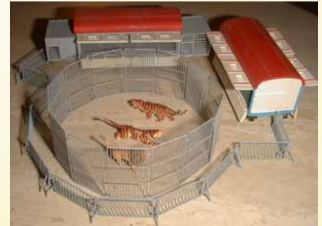
Tierschau- Ansucht mit Teilen des Zentralkäfigs, Raubtierwagen mit Veranden ( Umbau- Preiser) mit modernen Gittern und Tierschau- Zäunen.

3111 Raubtierwagen - Veranden 2 Fertigmodelle