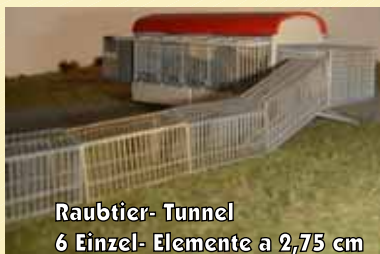
Raubtier- Tunnel 6 Einzel- Elemente a 2,75 cm

Raubtier - Freigehege "King Tonga" 22 zusammenhängende, filigrane vorbildnahe Gitterelemente incl. Eingangstür. (Passend zum "King Tonga" Wagen).